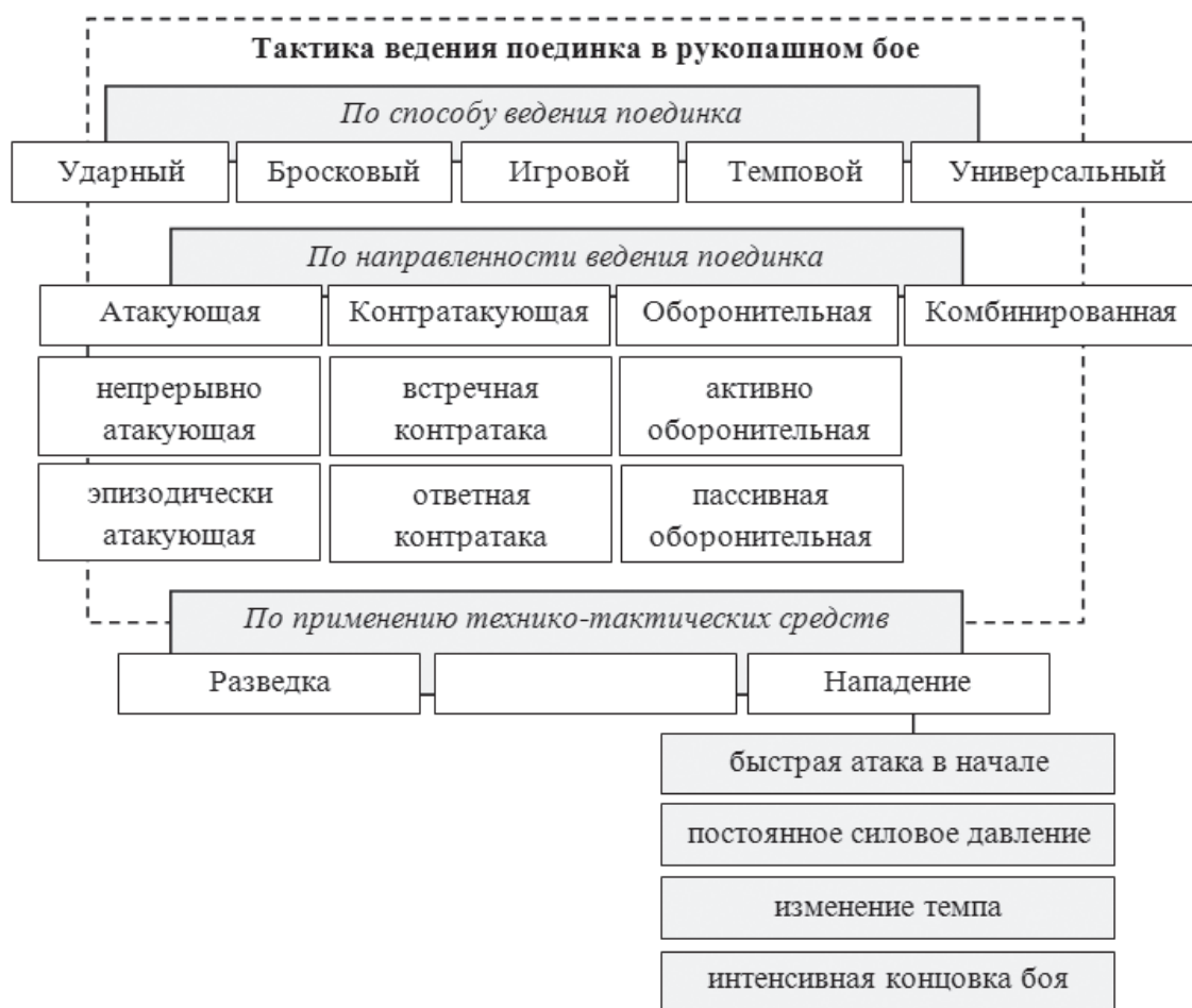
Рис. 1. Способы и направленность ведения поединка в рукопашном бое

Тактическая подготовка как процесс складывается из овладения теоретическими знаниями в области тактики и их практического использования в бою. Знания и умения по тактике приобретаются с помощью широкого круга методов, в их числе: