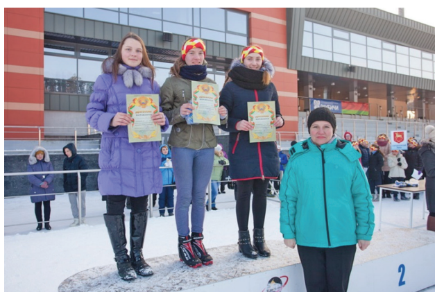
Рис. 4. Учащиеся Языльской средней школы им. Героя Советского Союза Половчени Гавриила Антоновича в составе сборных команд Стародорожского района и Минской области по биатлону «Снежный снайпер» на призы Президентского спортивного клуба: а — победители областного этапа; б — победители финала Республики Беларусь