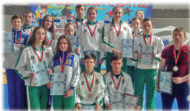
Рис. 5. Победители первенства Минской области по лыжным гонкам «Вместе с командой»: а — среди девочек и девушек; б — среди мальчиков и юношей