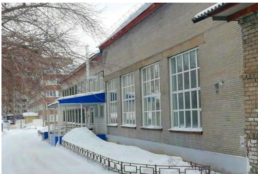
Фото: корпус АГМИ по улице Некрасова,65