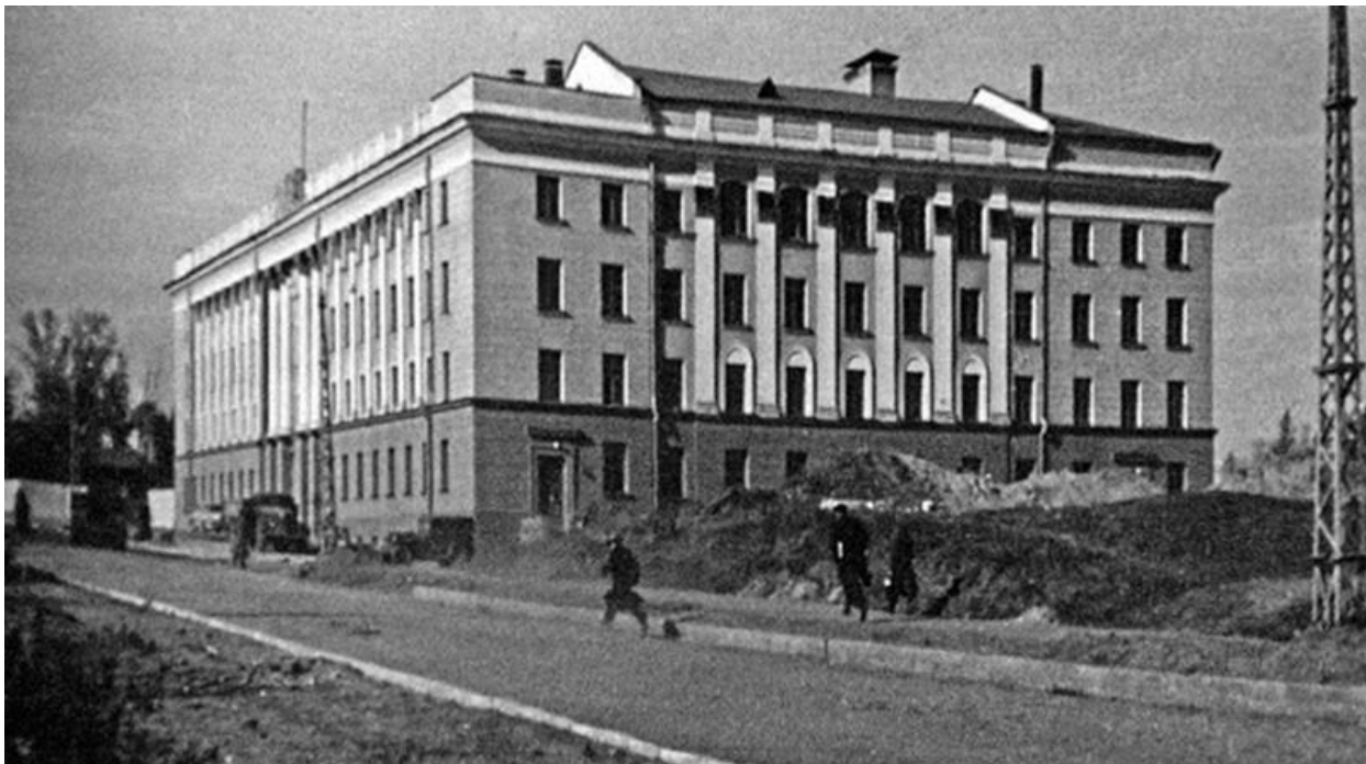
Фото: Строительство АГМИ. 1950-ые.