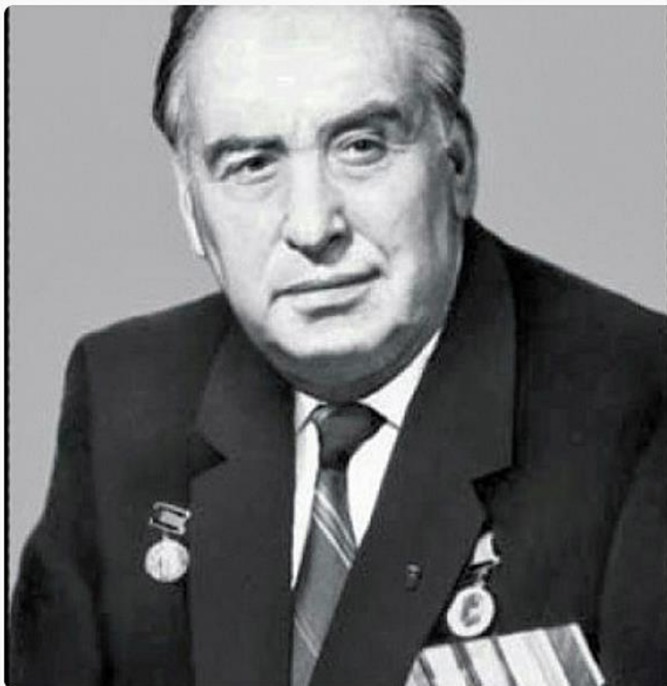
Фото: Крюков Виталий Николаевич (1930 – 2015), ректор АГМИ.

факультета: педиатрический и фармацевтический. При нем построили два новых учебных корпуса, общежитие, а кафедра физического воспитания получила отдельное здание и собственный стадион).