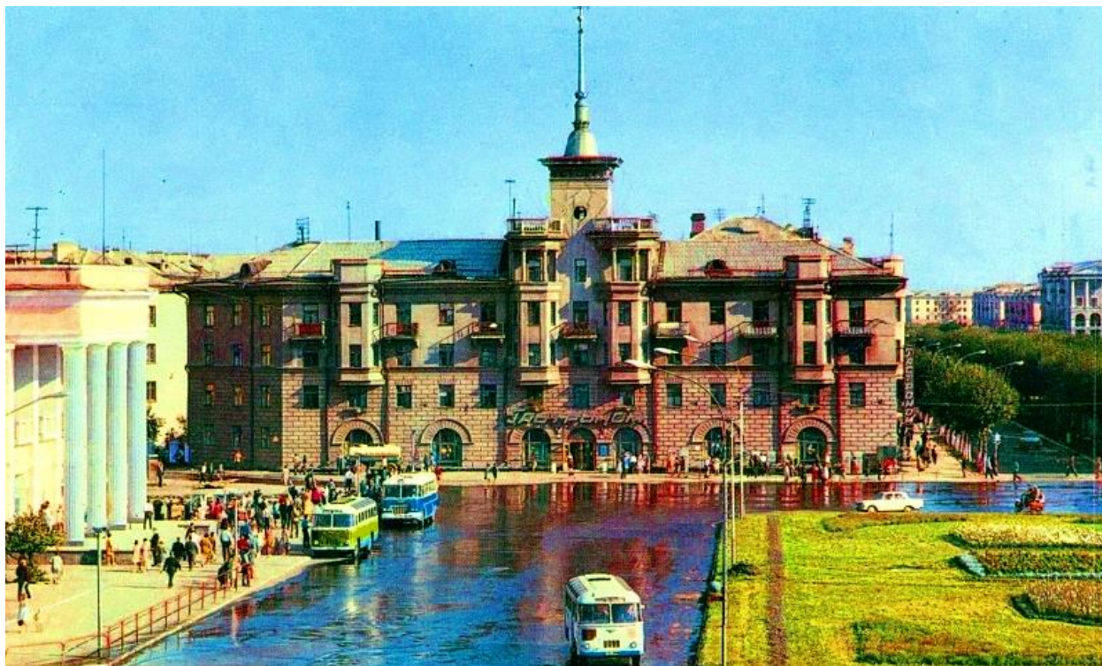
Фото: Дом под шпилем. 1970 – ые.

С новыми улицами и питерской архитектурой строилась у девчонок новая жизнь. Бегали они по всему городу: на стадионы "Динамо" и "Красное знамя", (последний ныне - парк Изумрудный), катались с горы в Дунькиной роще, (а теперь там краевая администрация и здание университета).