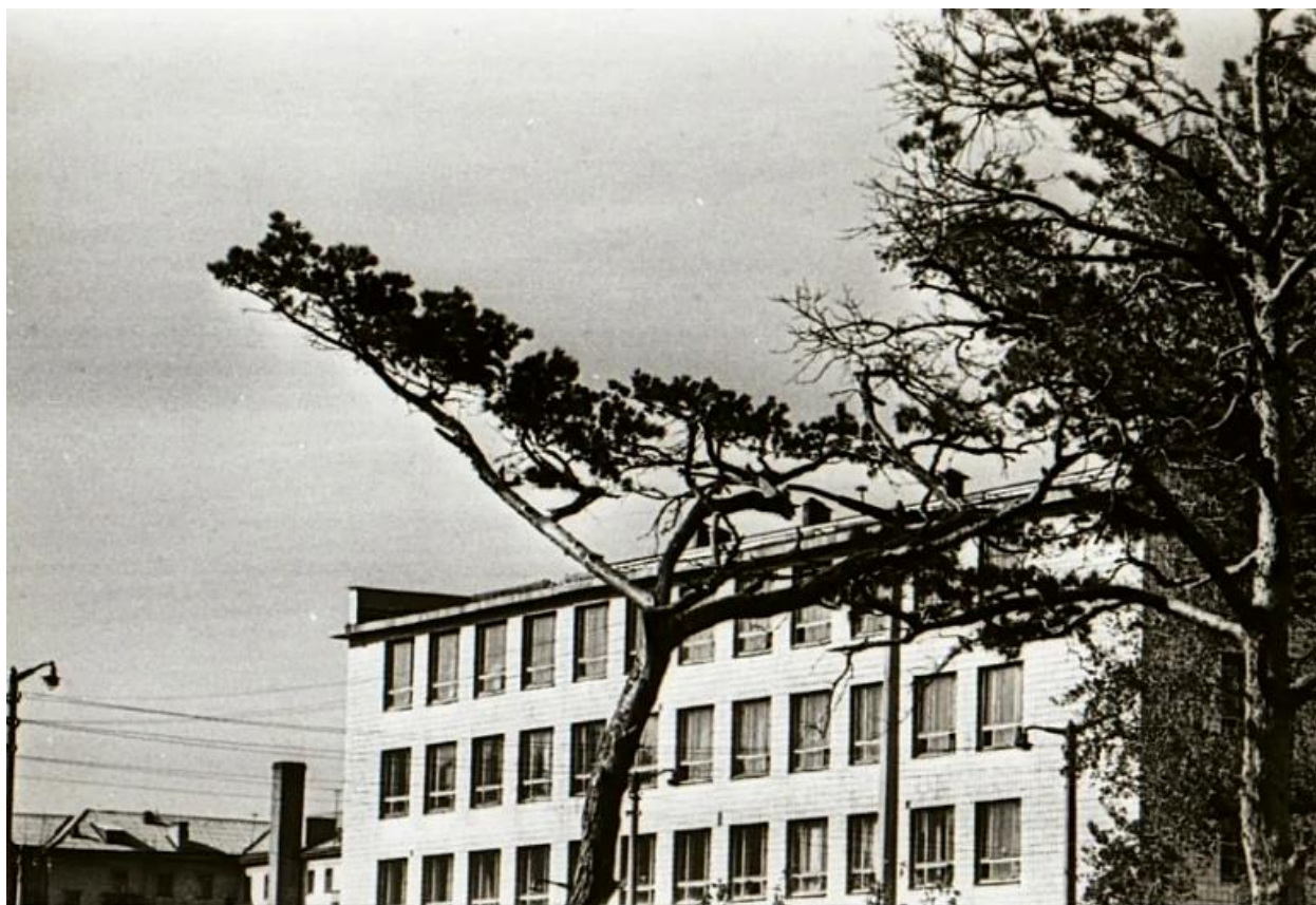
оследняя сосна "Дунькиной рощи" около Политехнического института, 1968 г.