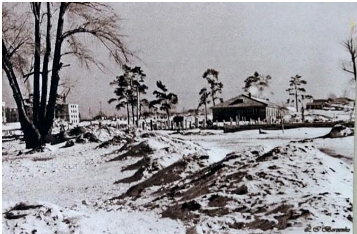
Фото: Остатки Дунькиной рощи. Город Барнаул. 1950 - ые.