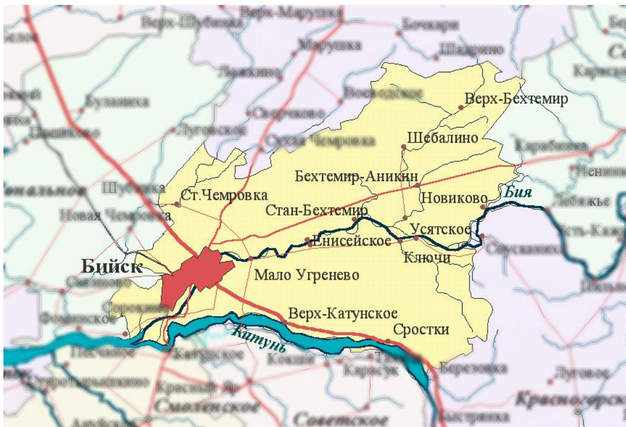
Рисунок 2. Карта Бийского района [19]

Dugnist P. Y., Romanova E. V., Truevtseva E. A., Kirilova A. A. 2019. Cultural resources of the Biysk district as a basis for the organization of cultural and educational tourism. Health, Physical Culture and Sports, 1 (12), pp. 170-181 (in Russian). URL: http://journal.asu.ru/index.php/zosh