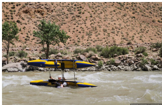
Рис. 6. Водный туризм. Монголия-2013. URL: http://greataltai.com