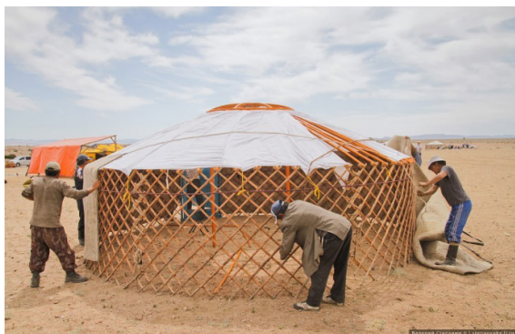
Рис. 5. Установка лагеря участников фестиваля. Монолия-2013.