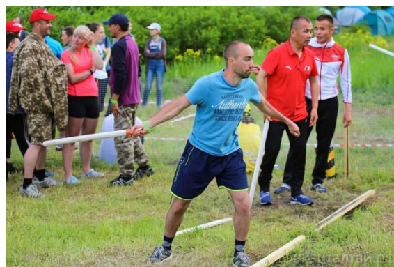
Рис. 12. Городошный спорт. Россия-2019.