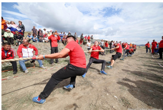
Рис. 7. Перетягивание каната. Казахстан-2017.