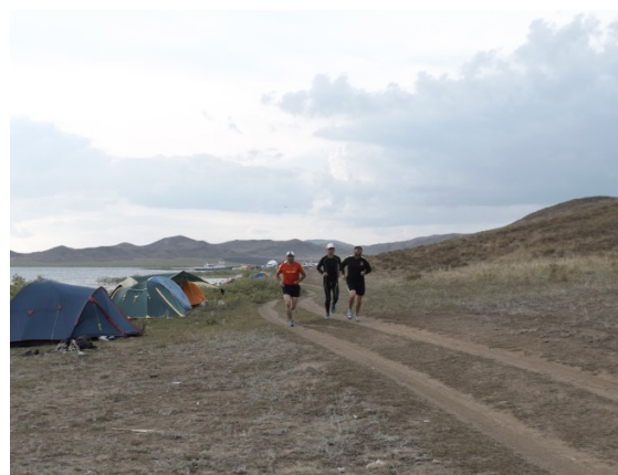
Рис. 4. Лагерь участников фестиваля на берегу Бухтарминского водохранилища. Казахстан-2017.