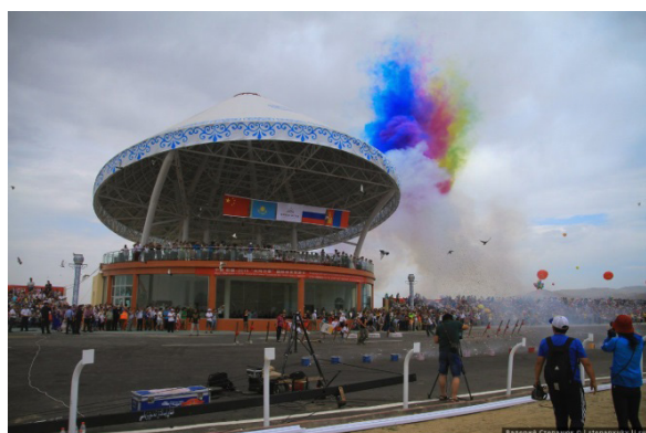
Рис. 1. Открытие фестиваля. Китай-2015.

ненных горной системой Алтая, и включает в себя различные виды спорта в природной среде. К ним относятся: спортивный туризм (дистанции пешеходные, водные, велосипедные, горные, комбинированные, авто-мотодистанции), рафтинг, альпинизм (скайраннинг), скалолазание, рыболовный спорт, мотопланеризм и парапланеризм, перетягивание каната, спортивное ориентирование, велотуризм, пешеходный, водный, горный, комбинированный туризм. Выбор данных видов обусловлен спецификой их проведения, не требующей создания искусственных спортивных объектов, а проводимых в естественной природной среде. На представленных ниже фотографиях, сделанных в разные годы проведения фестиваля, показаны отдельные моменты спортивных мероприятий, наглядно иллюстрирующих гармоничное сочетание различных видов туризма и спорта в природной среде.