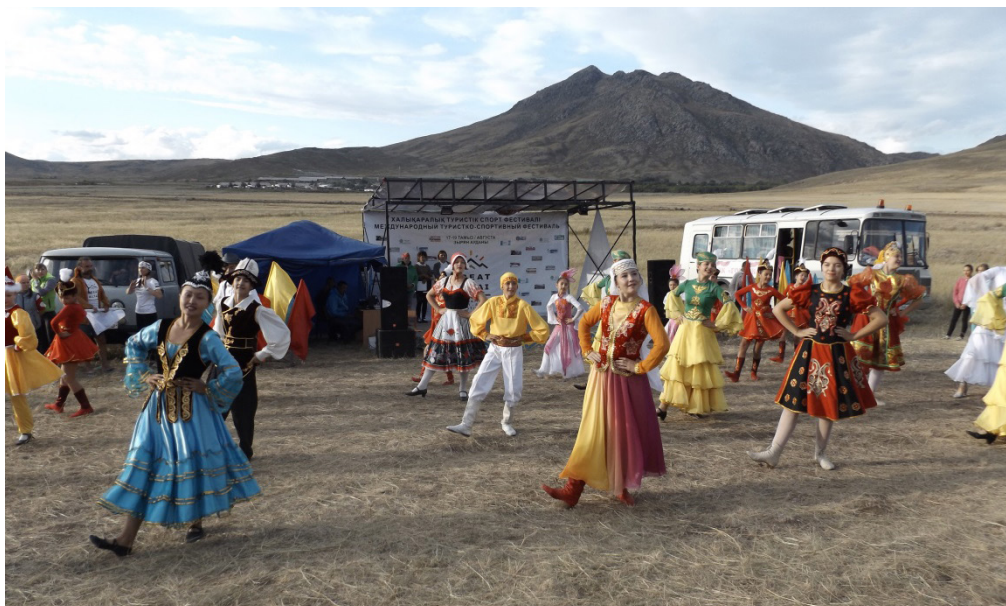
Рис. 13. Культурная программа. Казахстан-2017.

Культурная программа фестиваля, выдержанная в этническом стиле стран-участниц, позволяет ознакомиться с культурно-историческими особенностями, обычаями и традициями народов региона Большой Алтай.