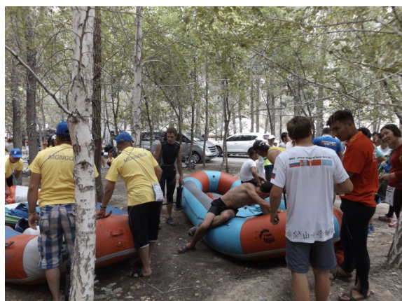
Рис. 3. В лагере участников фестиваля. Китай-2015.