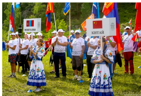
Рис. 2. Открытие фестиваля. Россия-2019.