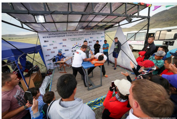
Рис. 9. Армрестлинг. Казахстан-2017.