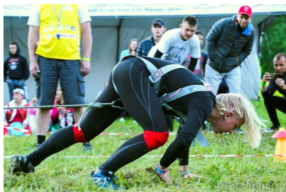
Рис. 11. Перетягивание человеком как быком. Россия-2019. URL: http://www.visitaltai.info