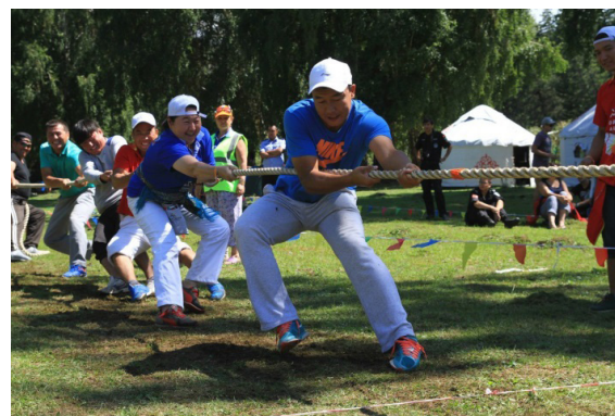
Рис. 8. Перетягивание каната. Китай-2015.