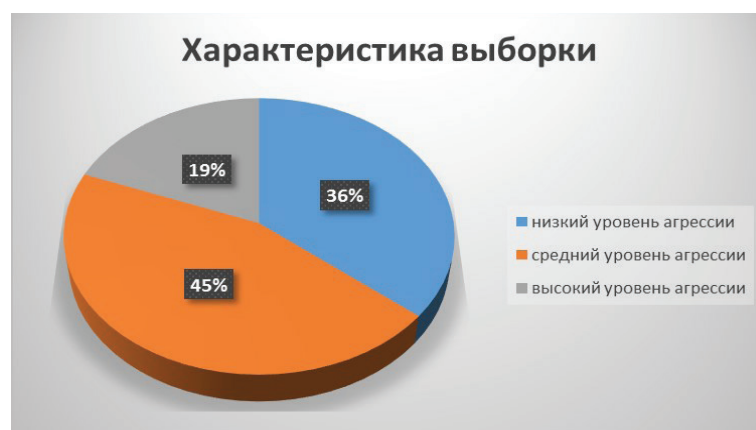
Рис. 1. Проявление агрессии в поведении близнецов-дошкольников

Представим в виде диаграммы общую характеристику выборки (рис. 1).