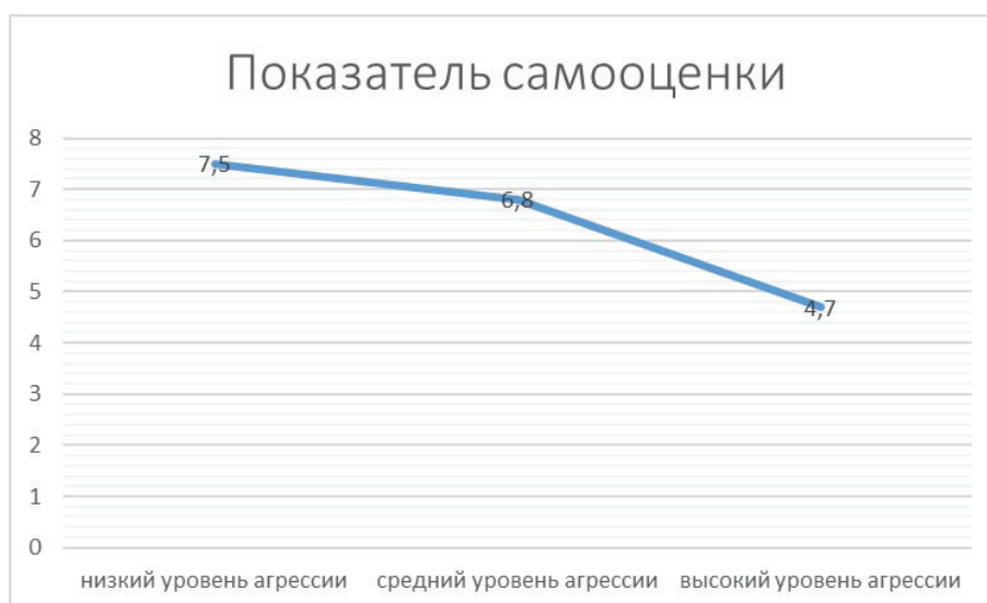
Рис. 2. Сравнительный анализ показателя самооценки в трех группах испытуемых по методике «Какой Я» О.С. Богдановой

В результате применения однофакторного ANOVA выявлены достоверные различия по показателю самооценки по методике «Какой Я» О.С. Богдановой ( F = 4,16 при p \leq 0,01 ) в трех группах испытуемых (рис. 2).